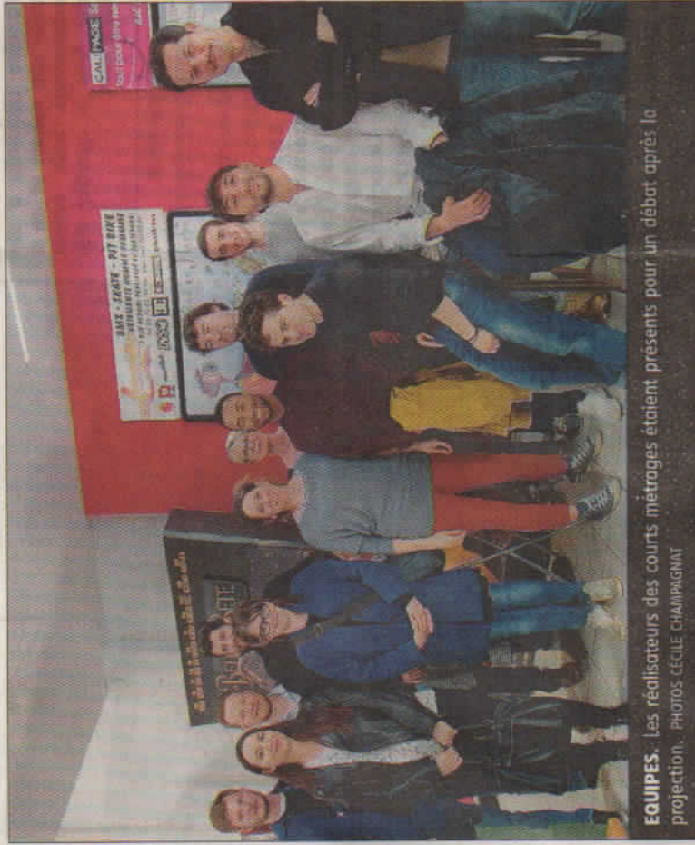
EQUIPES. Les réalisateurs des courts métrages étaient présents pour un débat après la projection.

Parmi les films présentés, « Garden Party », un court-métrage d'animation qui met en scène des grenouilles dans une villa abandonnée. Victor et Gabriel sont membres de l'équipe et ont réalisé le court pendant leur dernière année d'école d'animation. Leur film a reçu une mention spéciale du jury lors du festival de Clermont-Ferrand et plusieurs nominations à l'international. Les jeunes amateurs sont heureux d'être présents à Montluçon : « C'est assez petit donc du coup, c'est familial. On parle avec les