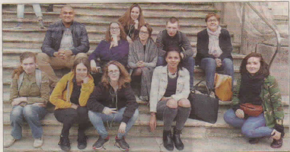
CONTENTS. Sur les marches du Théâtre Gabrielle Robinne, à Montluçon, les élèves du lycée Geneviève-Vincent ont savouré leur victoire.

À noter que ce premier prix a été obtenu pour la deuxième année consécutive, après trois années d'existence de l'atelier. Le