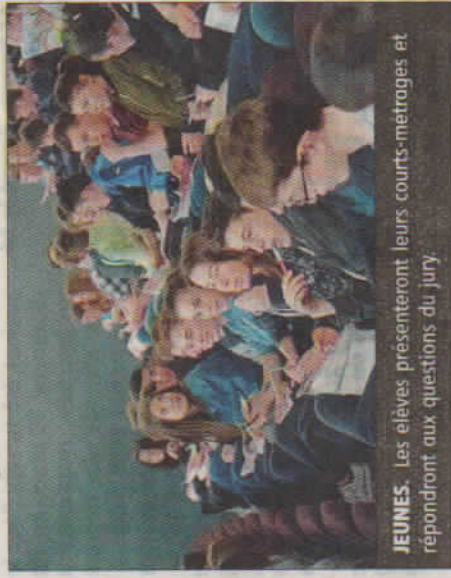
JEUNES. Les élèves présenteront leurs courts-métrages et répondront aux questions du jury.

La compétition des lycées et collèges a lieu aujourd'hui